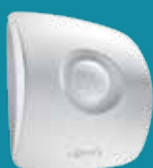
RÖRELS SENSOR INOMHUS