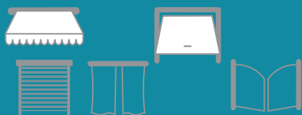
SOMFYS MORTORISERADE PRODUKTER

Kompatibel utrustning beroende på bostadens konfigurering