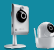
KAMEROR INOMHUS VISIDOM IC100 eller VISIDOM ICM100